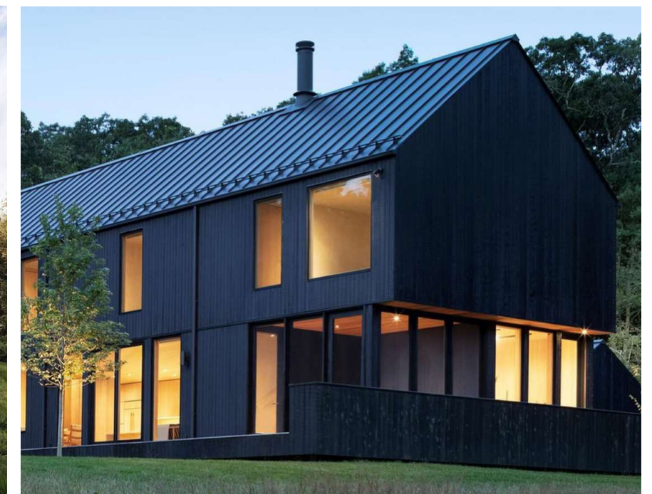
↑ Limiter le nombre de fini extérieur Jouer avec les ouvertures