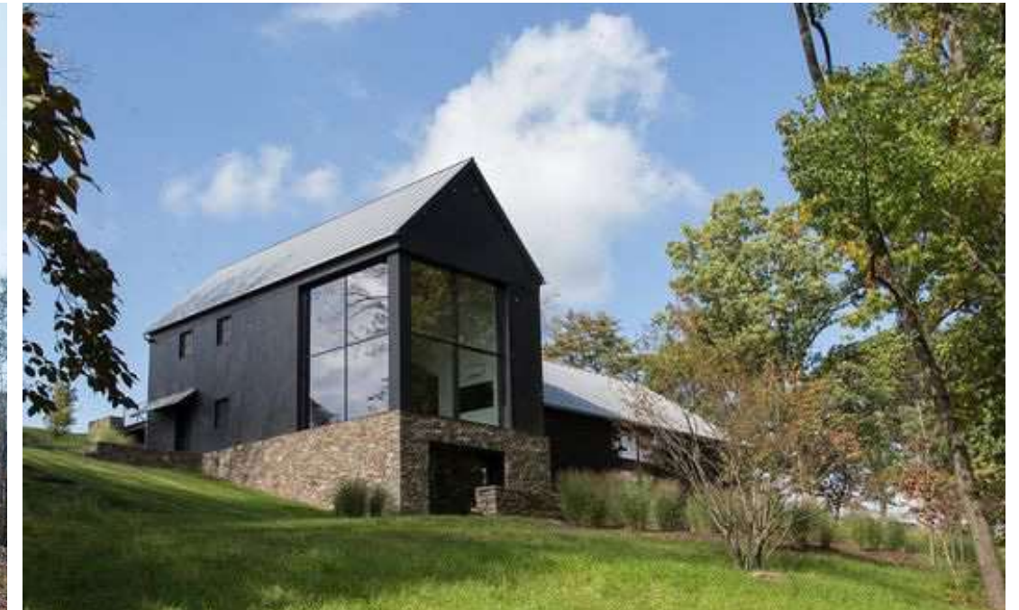
↑ S'intégrer à la topographie/de grandes ouvertures Se fondre au paysage naturel, utilisation de la pierre