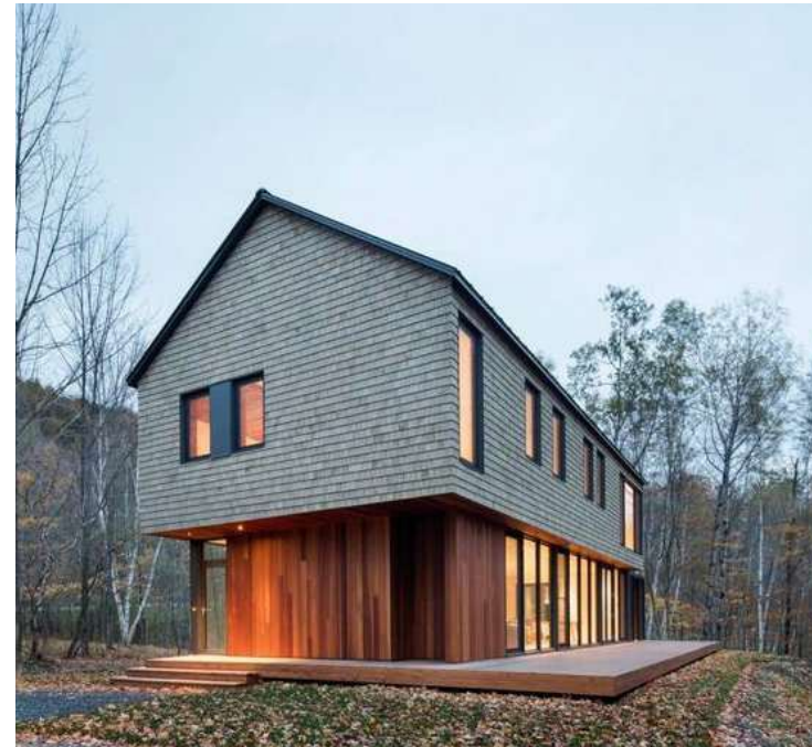
↑ Simplicité des volumes Architecture aux lignes nettes et dépourvues d'ornementation

Voici quelques images d'inspirations qui représentent la direction architecturale à proposer pour votre projet: