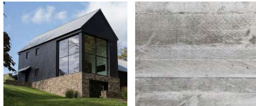
Couleurs à titre d'exemple.

Les échantillons devront être fournis à Destination Owl's head pour approbation.