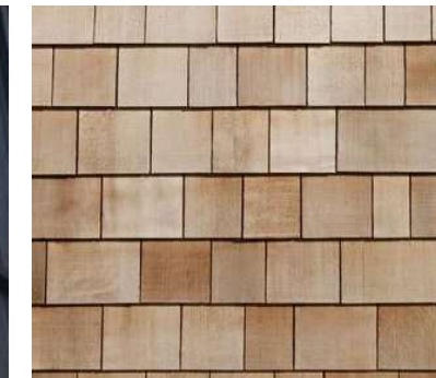
Bardeaux de cèdre