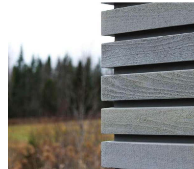
De type, SidexAlt

Les échantillons devront être fournis à Destination Owl's head pour approbation.