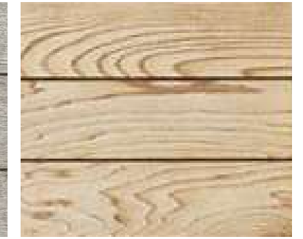
Couleurs à titre d'exemple.