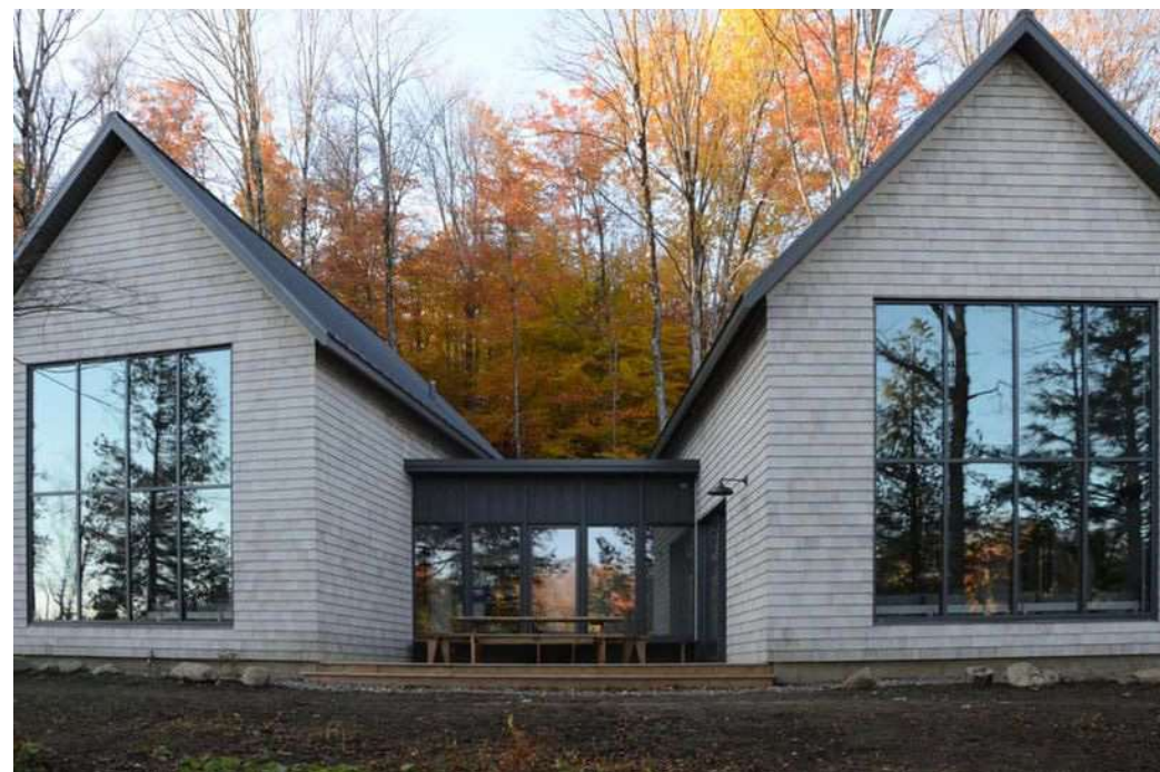
↑ Répétition de volumes / annexes Guidé par les espaces intérieurs