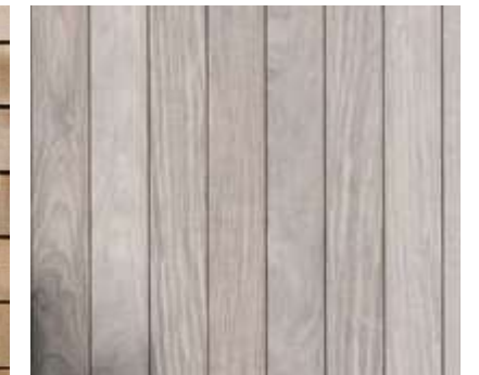
Lambris de bois Pose verticale ou horizontale