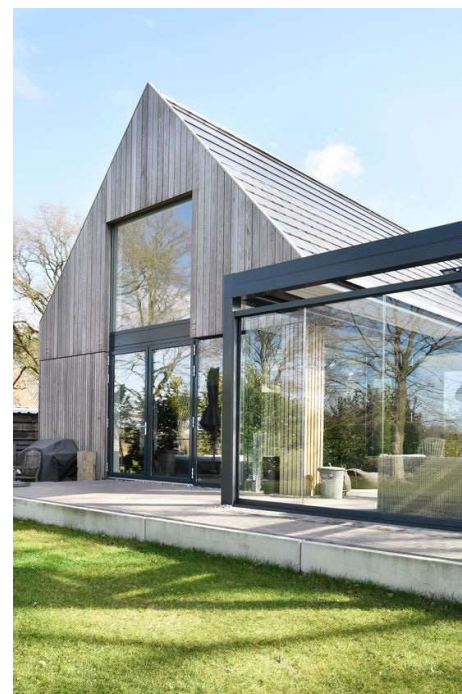
↑ Mariage des styles Ajout d'une annexe moderne