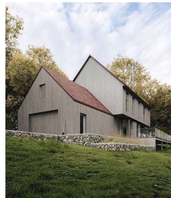
↑ Garage annexé à la maison Réduire la déforestation, muret de gabion